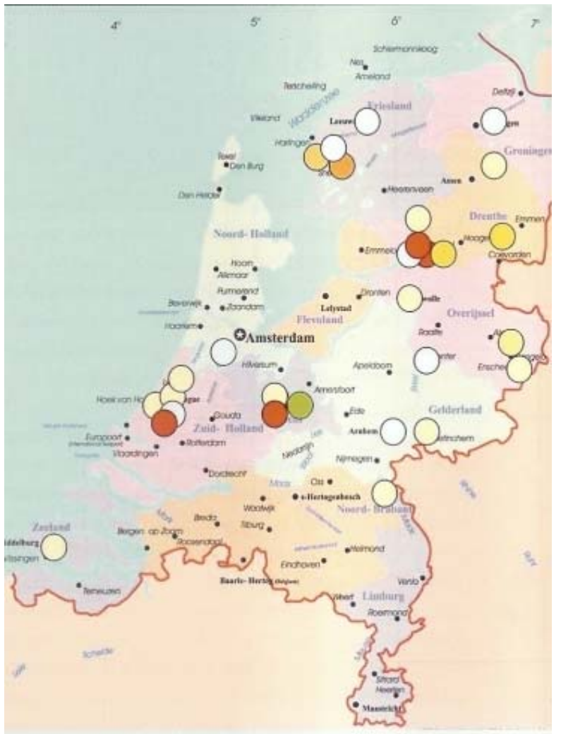
Overzicht van sanitatieprojecten, eind 2006.

Ако нямашме в Нидерландия изградени системи (канализация и пречиствателни станции), ние бихме направили дизайна по друг начин